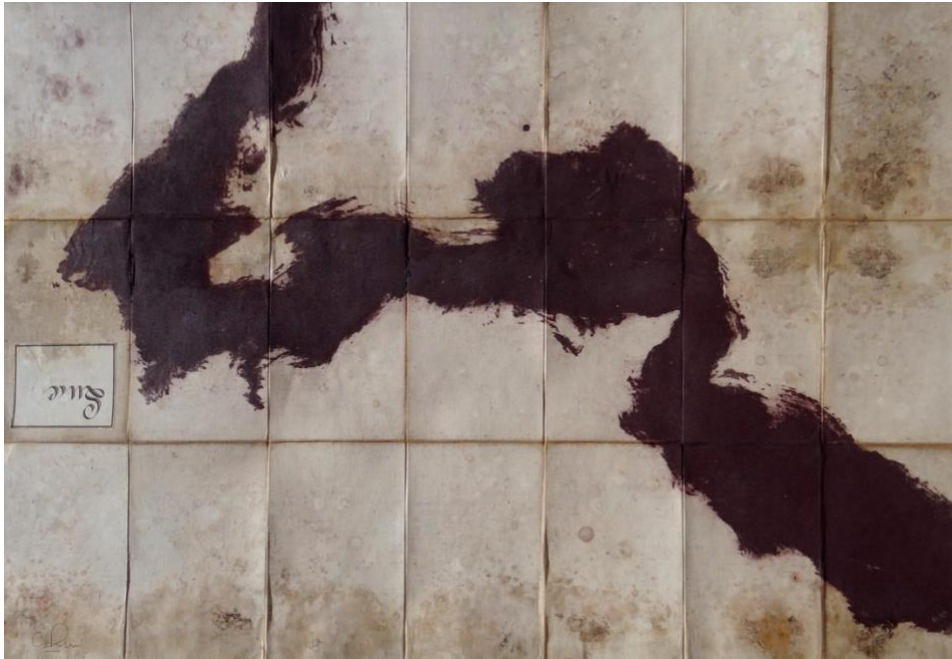
Anne Paulus - Nova descriptio IV (Luce) – 90 x 60 cm – 2017 Estampe sur carte ancienne originale toilée. Exemplaire unique