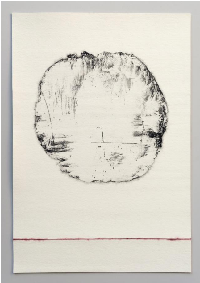
Anne Paulus - L'ombre du vide I – 106 X 67 cm - 2018 Estampe sur feutre naturel – exemplaire unique