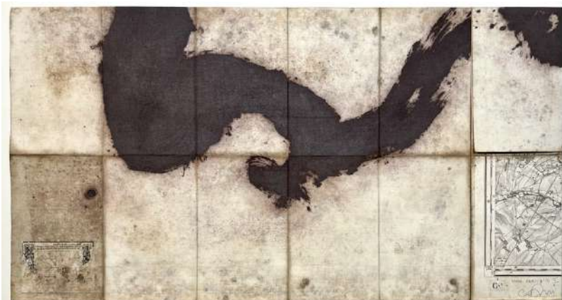
Anne Paulus – Nova descriptio II – estampe sur carte ancienne toilée – exemplaire unique 2017 – 40 x 74 cm – Crédit Anne Paulus