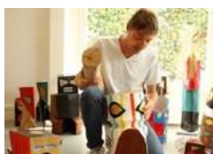
R1, sculpteur de totems robots 2020 (19')