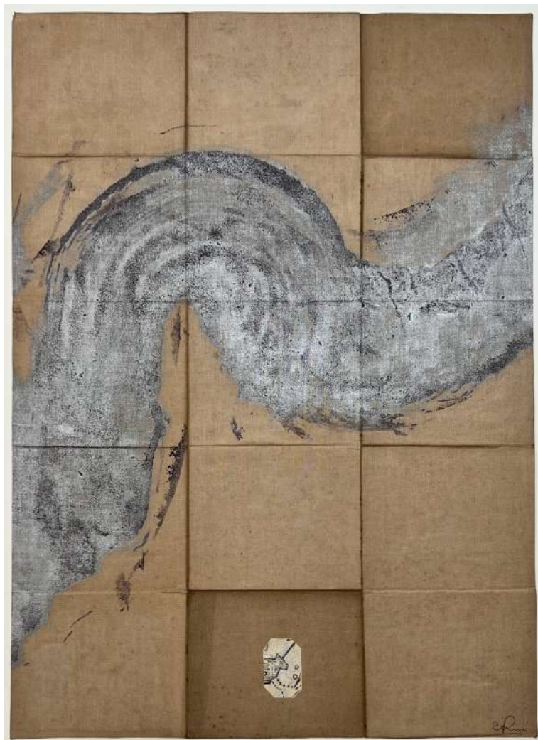
Anne Paulus – Nova descriptio XVII – estampe sur carte ancienne toilée – exemplaire unique 2022 – 49x 35 cm – Crédit Anne Paulus