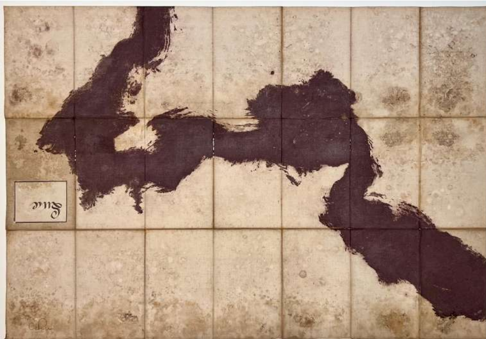
Anne Paulus – Nova descriptio IV – estampe sur carte ancienne toilée – exemplaire unique 2017 – 60x 87 cm – Crédit Anne Paulus