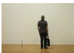
Rencontre avec Horacio Cassinelli 2019 (63') GSB Éditions