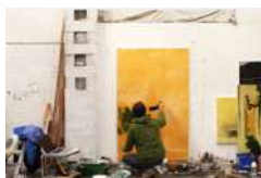
Rencontre avec J.-Ph. Bruneaud 2019 (26')