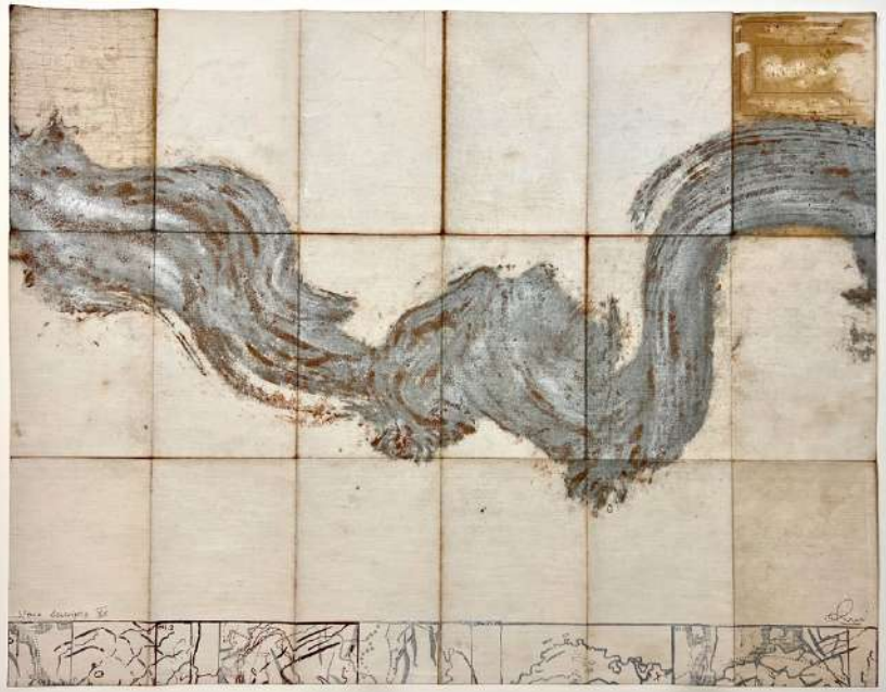
Anne Paulus – Nova descriptio XV – estampe sur carte ancienne toilée – exemplaire unique 2022 – 44x 56 cm – Crédit Anne Paulus